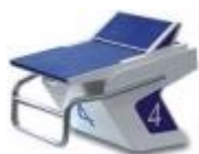
Plot pékin à enregistrement de temps de réaction (réactif)

Lorsque l'équipement automatique qui juge les prises de relais est disponible, il doit être utilisé.